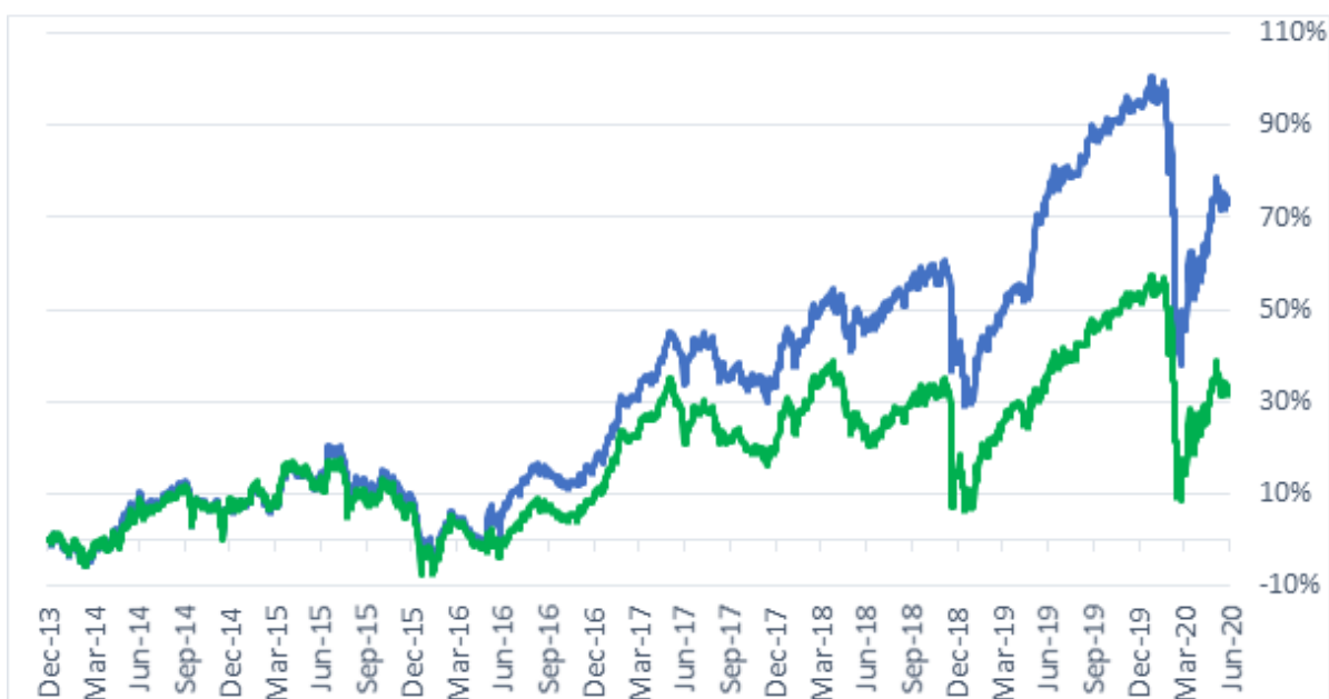
Evolutia ETF BET Tradeville si evolutia indicelui BET de la lansarea ETF; Sursa: BVB, S.A.I. Tradeville Asset Management S.A.

office@sai-tradeville.ro, www.sai-tradeville.ro