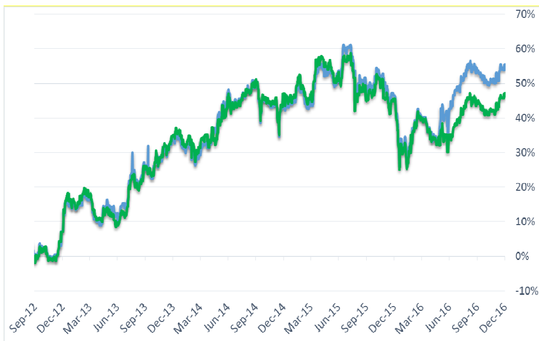
Evolutia indicelui BET si evolutia ETF BET Tradeville de la lansare

In graficele de mai jos prezentam o comparatie intre evolutia indicelui BET si evolutia ETF BET Tradeville de la lansarea din 29.08.2012 si pana la 31.12.2016, respectiv structura portofoliului ETF BET Tradeville la 31.12.2016.